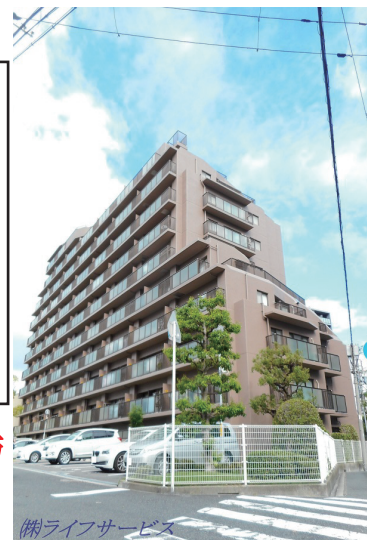
(例)ライフサービス