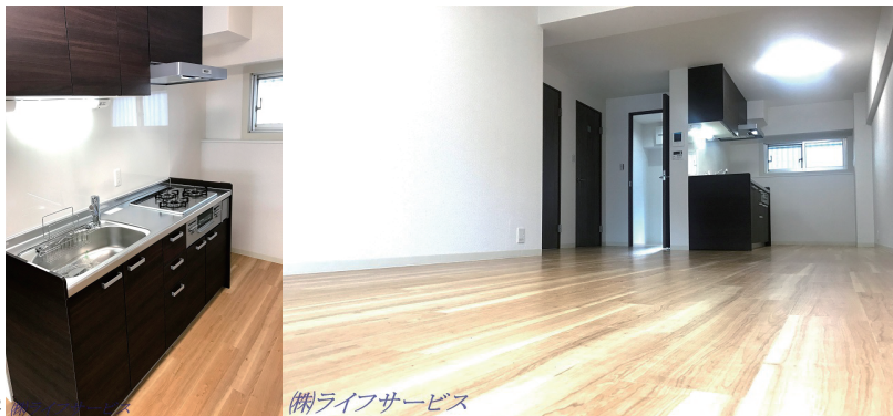
(例)ライフサービス