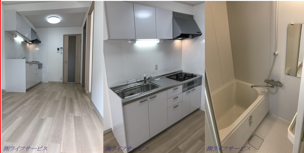
(株)ライフサービス